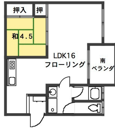
シャトーイト 402号のみ平面図

※室内美室! 特別仕様! 平成27年8/末完成! ◎交通買い物便利! ※地デジ・BS・CS受信可! ※火災保険料(要) 2年¥20,000- ※ペット不可! 全保連保証会社(要加入) ※短期解約違約金有り「1年未満解約時は違約金として賃料の2ヶ月分を支払う事」※